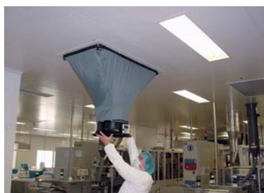
Contrôle des débits d'air et taux de brassage

audit contrôle conseil Qualification de salles propres Formation et sensibilisation à la prévention de la contamination