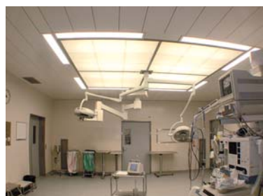
Comptage des particules sous un diffuseur d'une salle d'opération