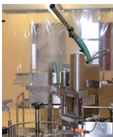
Visualisation d'un flux d'air